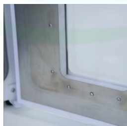
Diseño con esquinas redondeadas: facilita la higiene y mantenimiento.