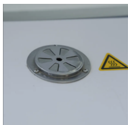
Sistema de seguridad con alarma de sobretemperatura