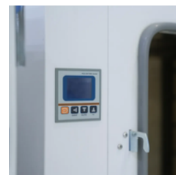
Pantalla LCD digital: visualización y ajuste de temperatura.