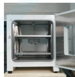
Ventana frontal tipo G: permite observación sin pérdida de temperatura.