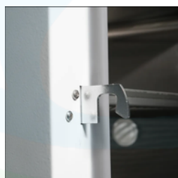
Puerta con gancho de cierre: garantiza un sellado seguro y estable durante el funcionamiento